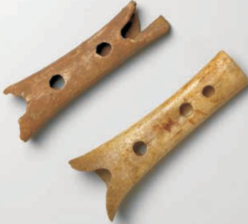
Die älteste flöte in der Welt, 250.000 Jahre alt * Neandertaler flöte aus Höhle Divje babe, Loza bei Orehek