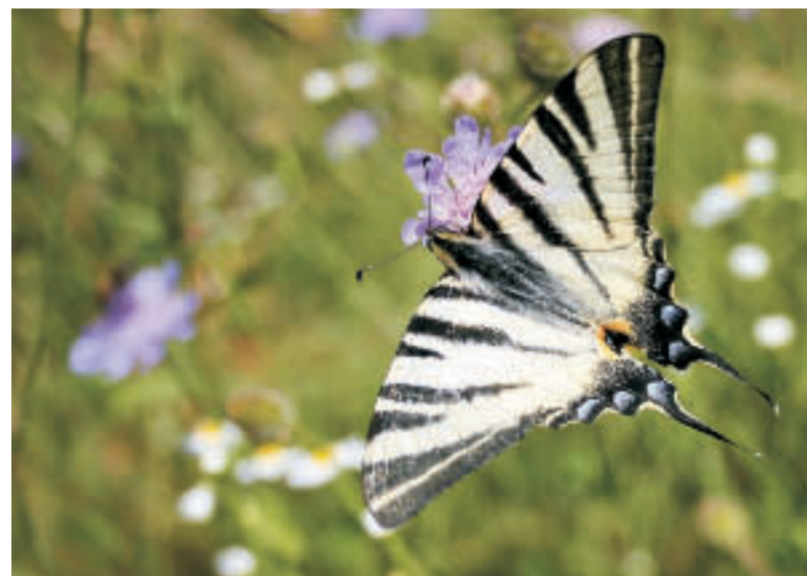
Jadralec (Segelfalter), Iphiclides podalirius geschützt

SLOVENSKO DRUŠTVO CARLA ORFFA Makedonska 30, SI-2000 Maribor, Slovenija * Slowenien www.slорff.si * info@slорff.si