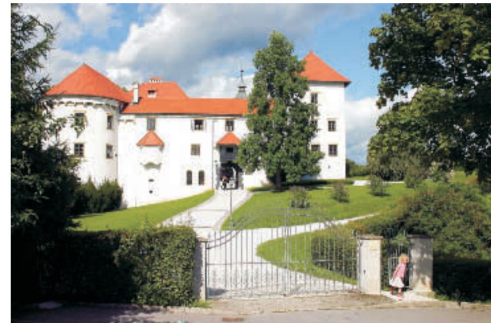
Schloß Bogenšperg, Prinzessin auf der Fluht