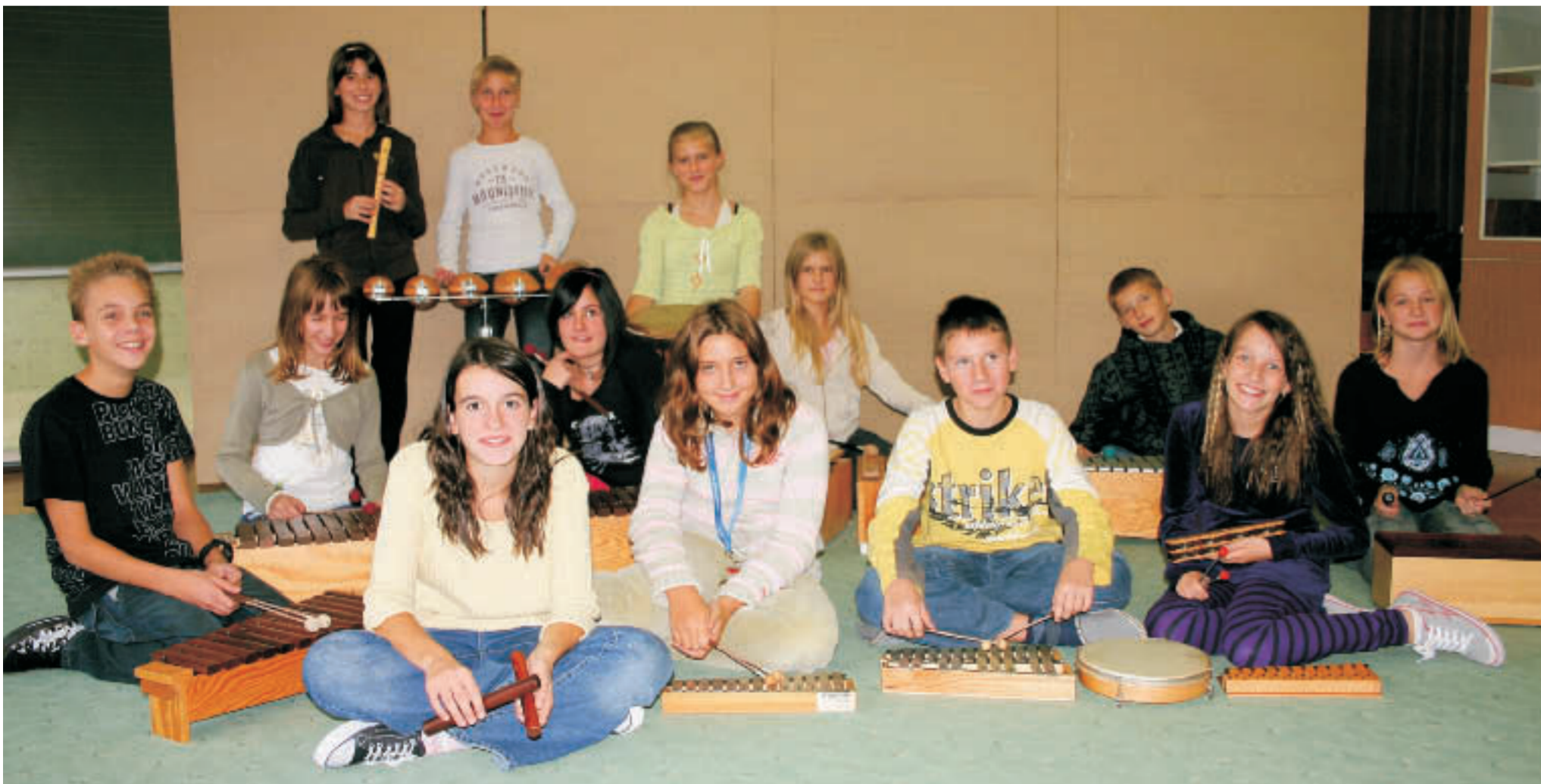
Grundschule BORCEV ZA SEVERNO MEJO Maribor - Orffgruppe ORFFEJČEK