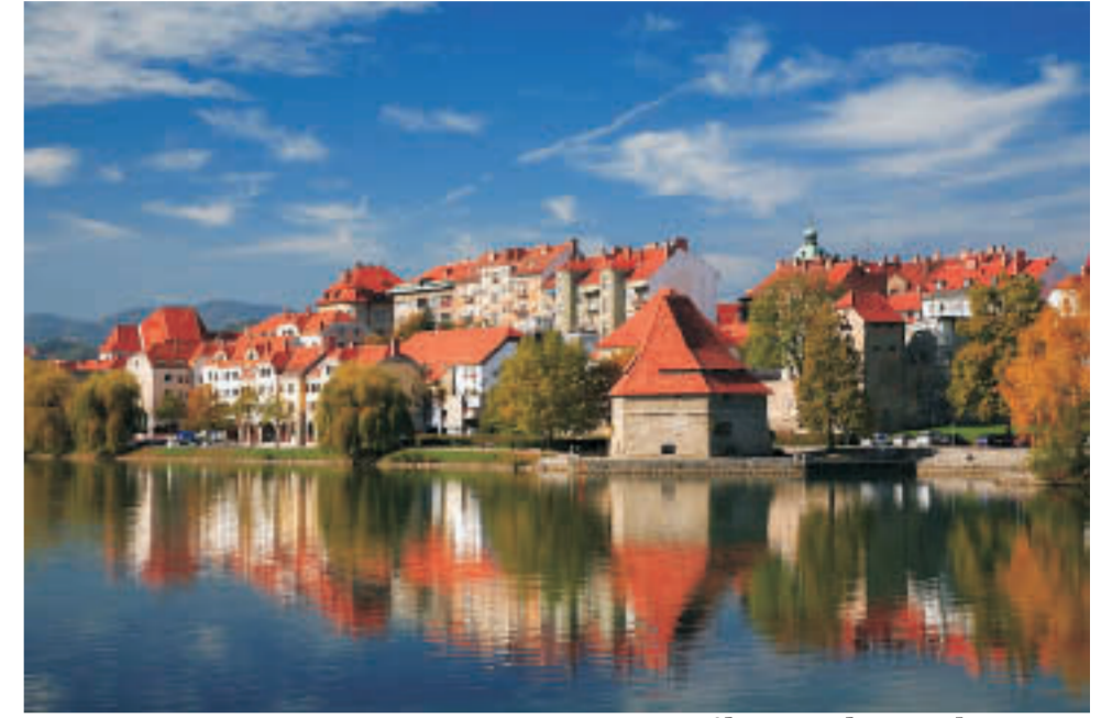
Maribor, altstadt Lent

SLOWENIEN, Republik in Mitteleuropa, die an Italien, Österreich, Ungarn, Kroatien und die Adria grenzt. fläche: 20.273 km 2 einwohnerzahl: 2.020.000 sprache: slowenisch (slovenščina) religion: 57,8 % Römisch-katholisch, 2,5 % Muslime, 2,3 % Orthodox, 0,9 % Protestanten hauptstat: Ljubljana (>278.000)