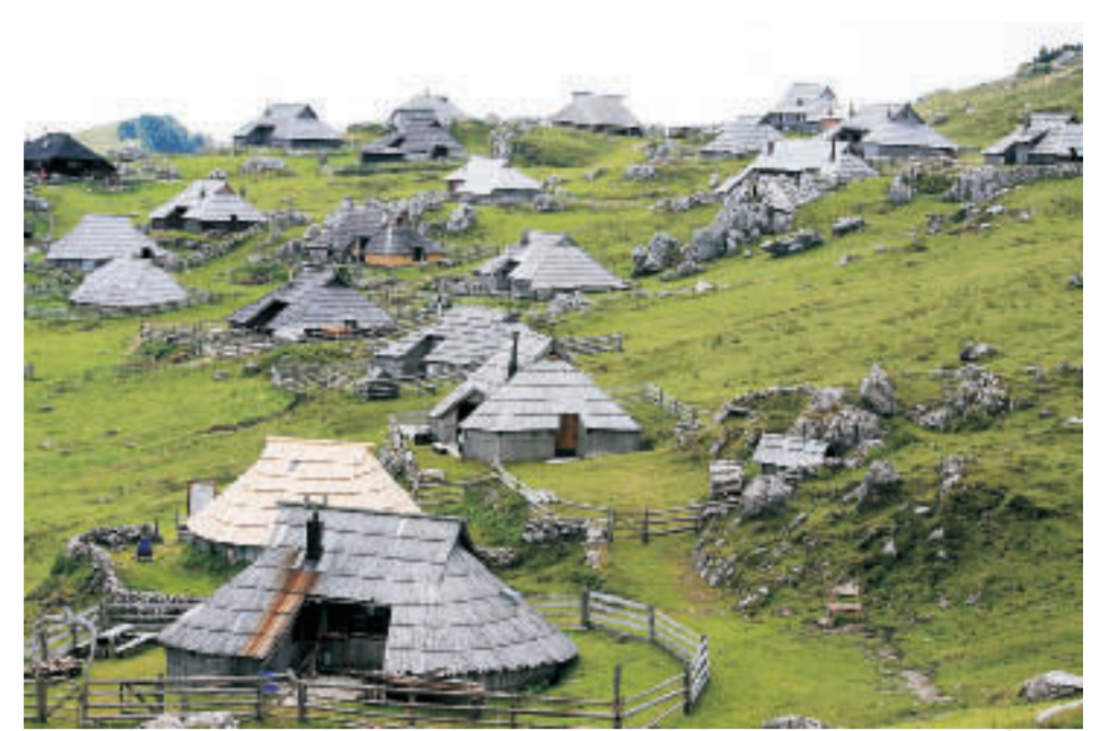
Velika Planina, Sennwirtschaften