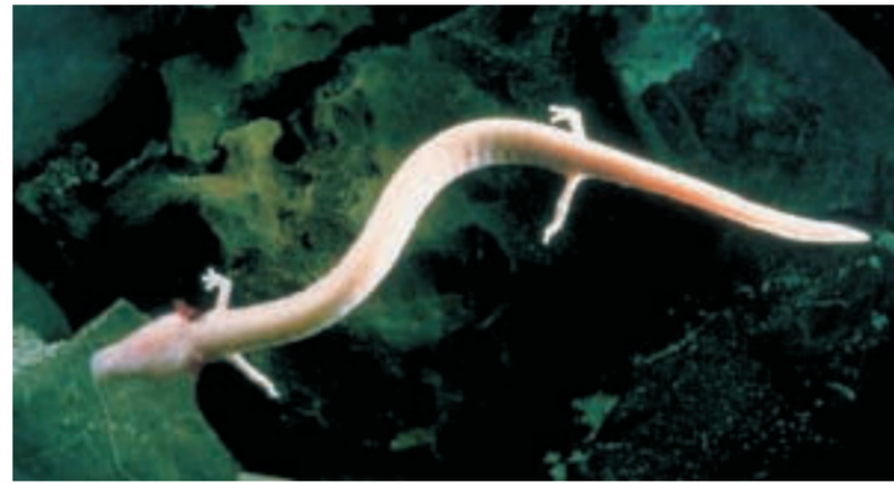
Človeška ribica (Grottenolm), Proteus anguinus , endemit im Postojna Höhle

SLOWENIEN, Republik in Mitteleuropa, die an Italien, Österreich, Ungarn, Kroatien und die Adria grenzt. fläche: 20.273 km 2 einwohnerzahl: 2.020.000 sprache: slowenisch (slovenščina) religion: 57,8 % Römisch-katholisch, 2,5 % Muslime, 2,3 % Orthodox, 0,9 % Protestanten hauptstat: Ljubljana (>278.000)