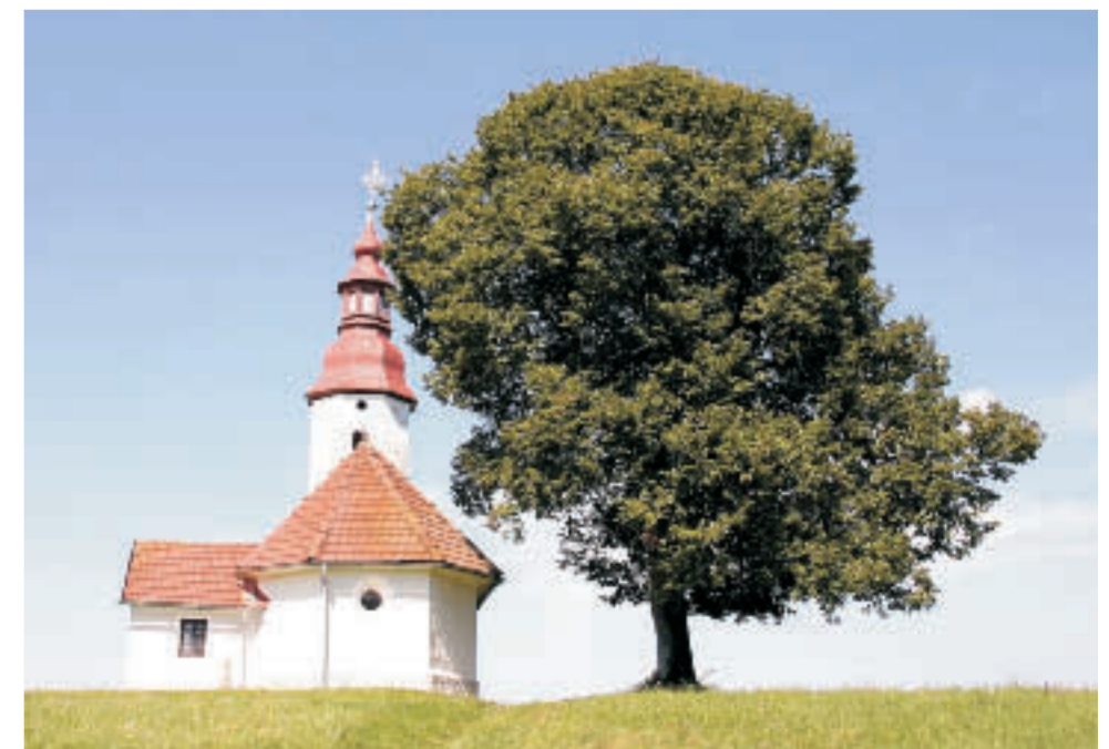
Die kirche von St. Nikolaus bei Mokronog