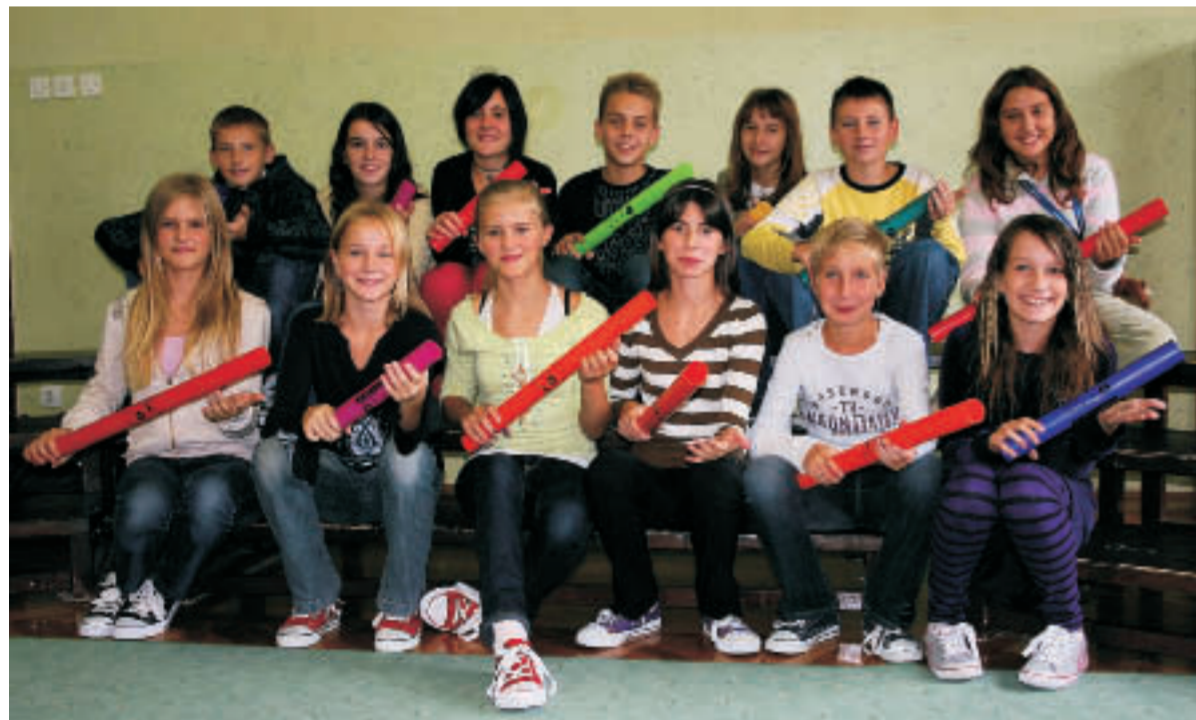
Grundschule BORCEV ZA SEVERNO MEJO Maribor - boomwhacker fans