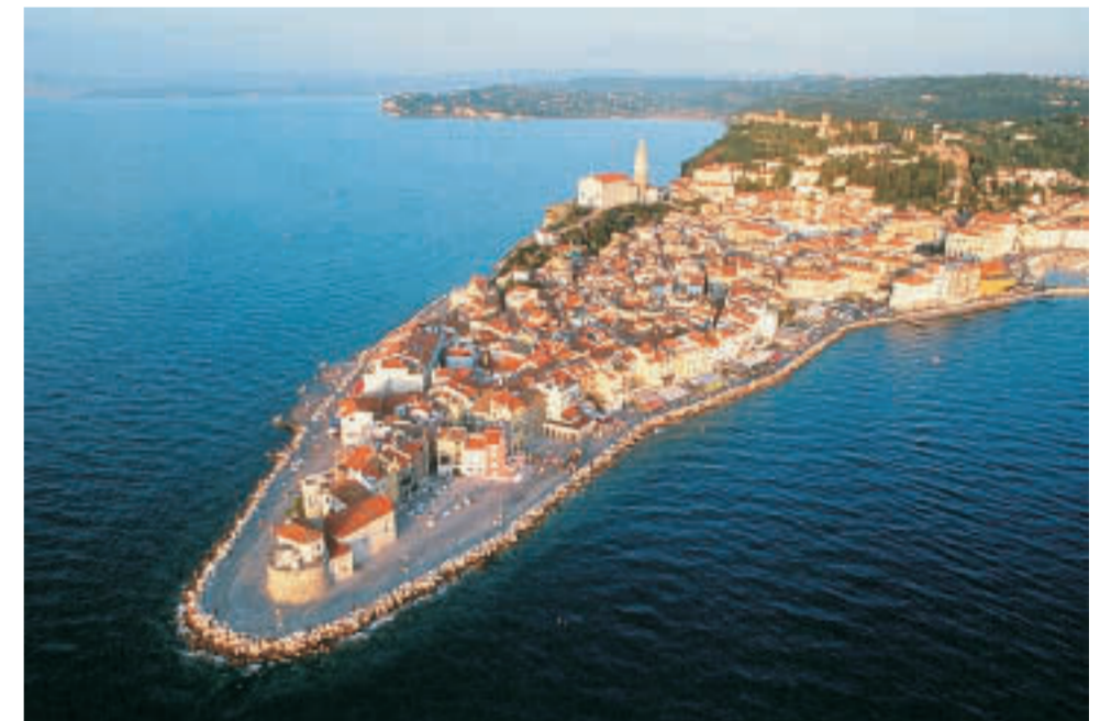
Altstadt Piran, Adriatisches Meer

SLOVENSKO DRUŠTVO CARLA ORFFA Makedonska 30, SI-2000 Maribor, Slovenija * Slowenien www.slорff.si * info@slорff.si